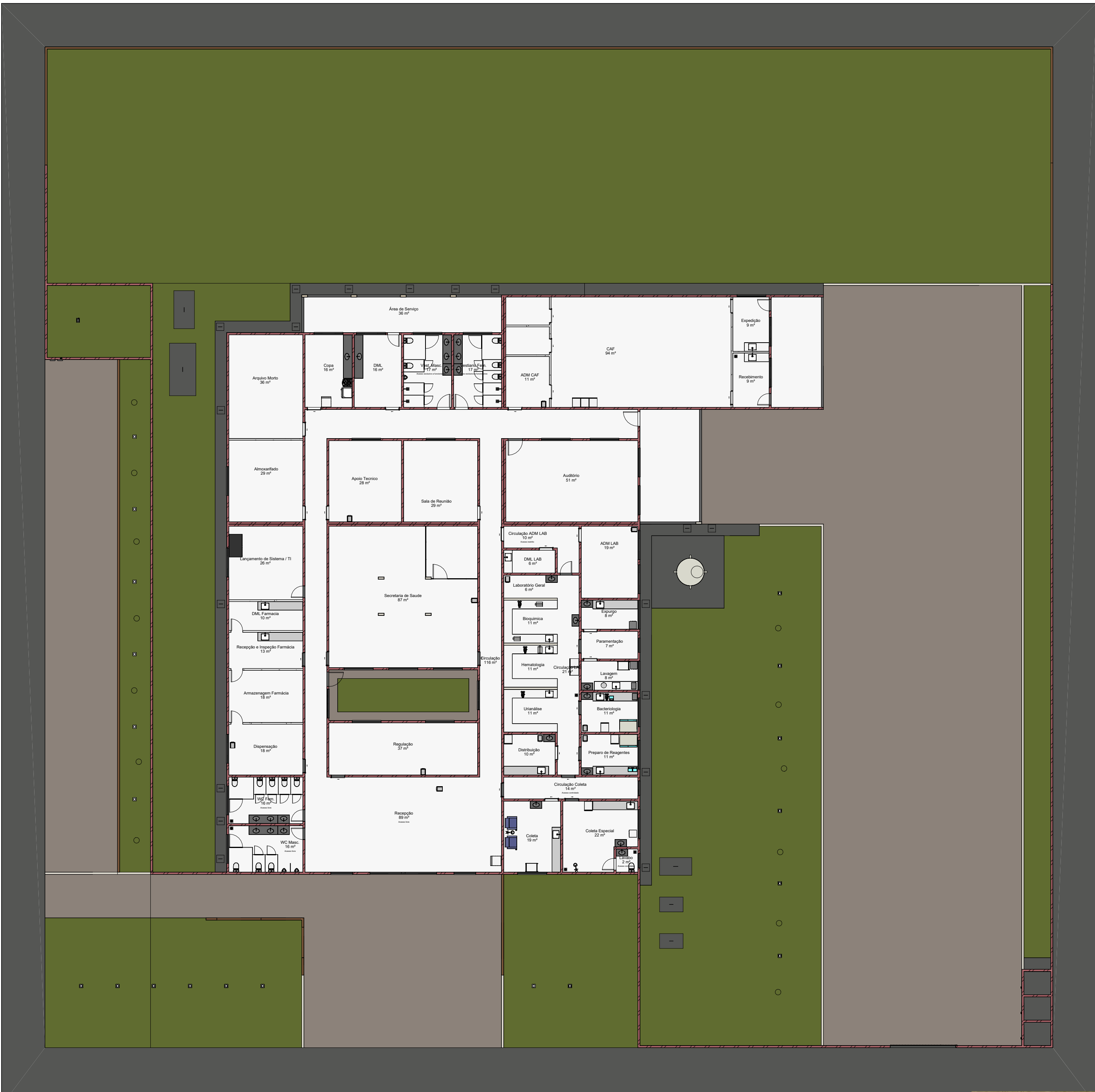
1 Planta Implantação 1 : 200