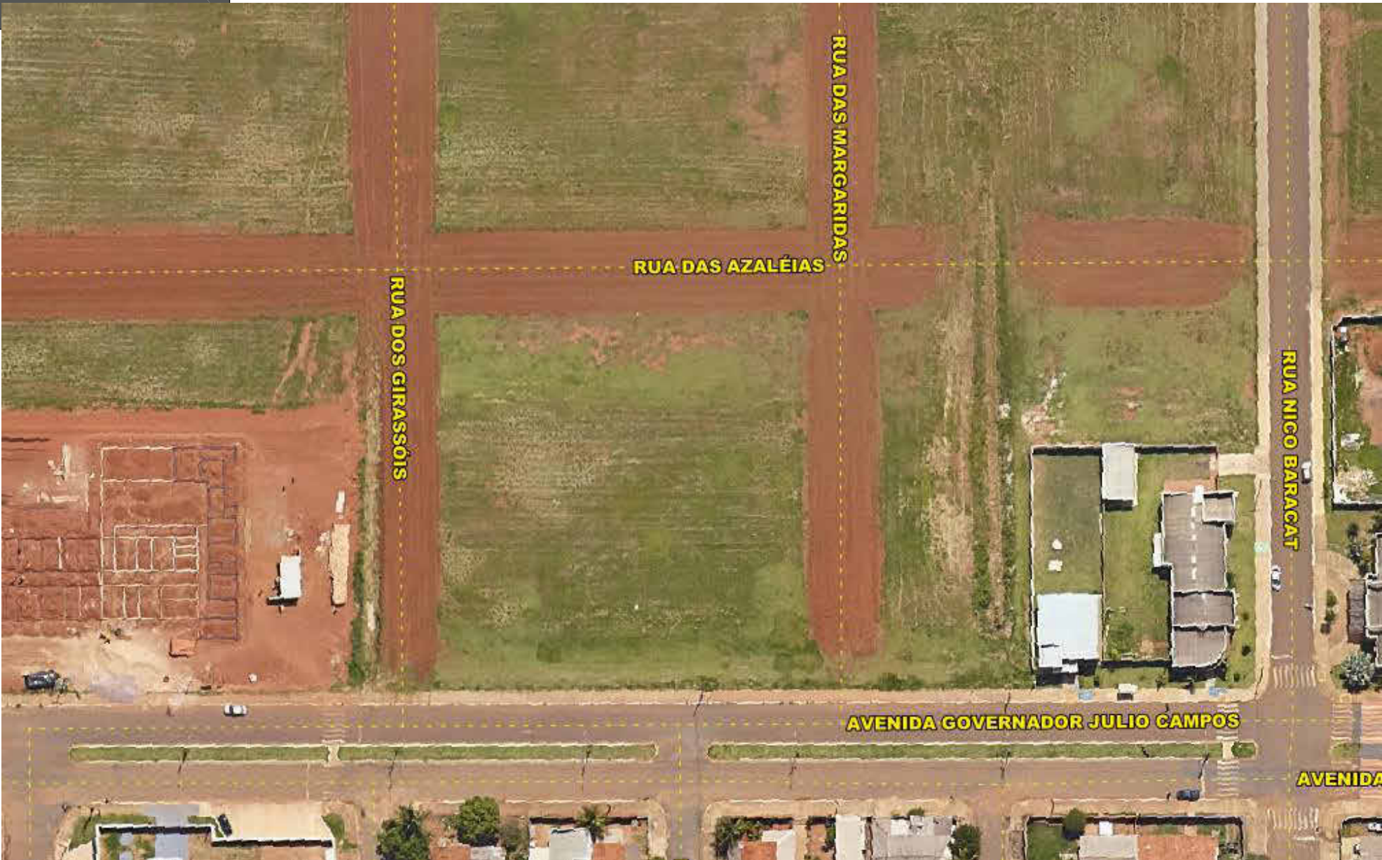
3 Local da construção 1 : 100